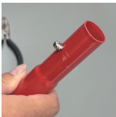
ロックピンが正しい位置 まで戻っている