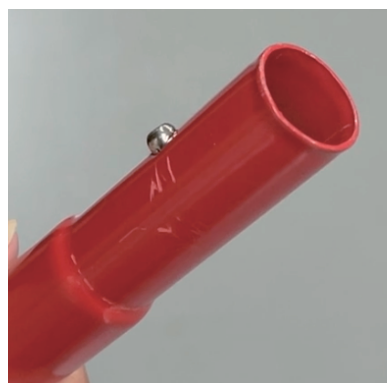
ロックピンが正しい位置 まで戻っていない

カリプトガレージのパイプで使用しているロックピンを押し込んだ場合、戻りが悪い場合が極稀に発生します。